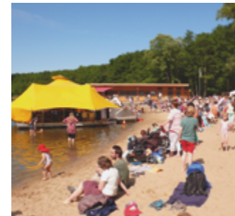
Ein neues Badehaus für das Naturbad Eichholz

Über 5000 Sportler aus der ganzen Welt nehmen im Sommer an den Internationalen Handballtagen teil. Es handelt sich um das zweitgrößte Handballturnier der Welt.