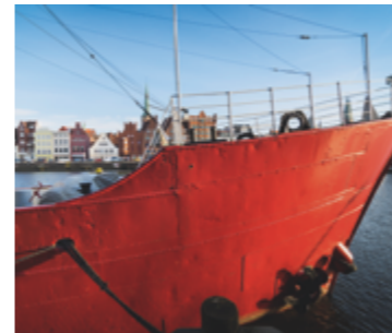
Denkmalpflege am Feuerschiff „Fehmarnbelt“

Wir unterstützen den Erhalt des kulturellen Erbes Lübecks und fördern kulturelle Teilhabe.