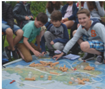
Unterstützung der Initiative „Zukunftsschule.SH“