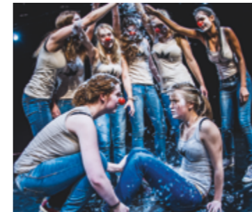
Förderung der Theaterpädagogik am Stadttheater

Um die Fahrsicherheit des historischen Schiffes zu erhalten, wurden großflächige Reparaturarbeiten an der Außenhaut durchgeführt.