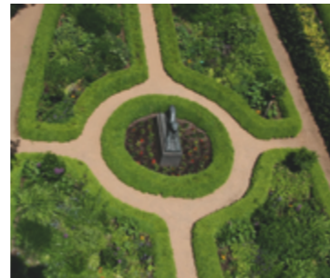
© Schulgarten Lübeck Umweltbildung im Schulgarten Lübeck

Die 5. & 6. Klassen der Oberschule zum Dom besuchten die Landesgartenschau zum Thema „Wie viele Erden brauchen wir?“